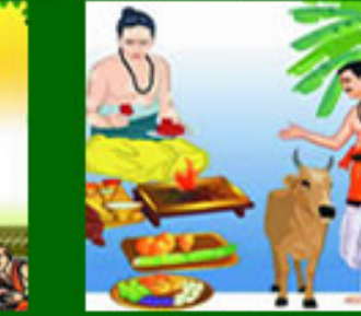
Ganapathi Homa Poojasamagri Kit